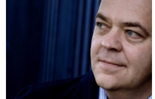
Peter Aalbæk Jensen Skuespiller