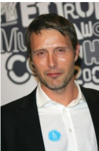
Jes Dorph-Petersen Skuespiller